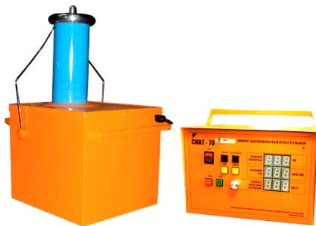
Рис. 1. Внешний вид измерительного и высоковольтного блоков.

Аппарат СКАТ-70 представляет собой переносной прибор, состоящий из двух блоков, высоковольтного и измерительного, которые соединены между собой кабелем. Внешний вид измерительного и высоковольтного блоков приведён на рис. 1.