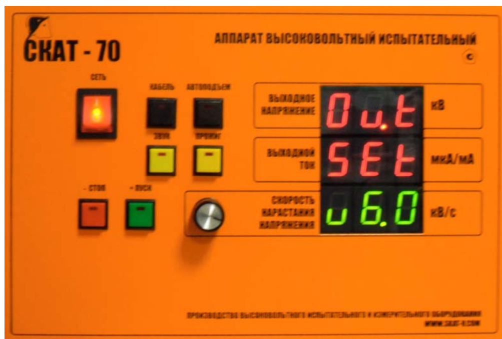
Рис. 2. Внешний вид передней панели измерительного блока.

светится десятичная точка, то сила тока отображается в миллиамперах, если десятичная точка не светится, то сила тока отображается в микроамперах.